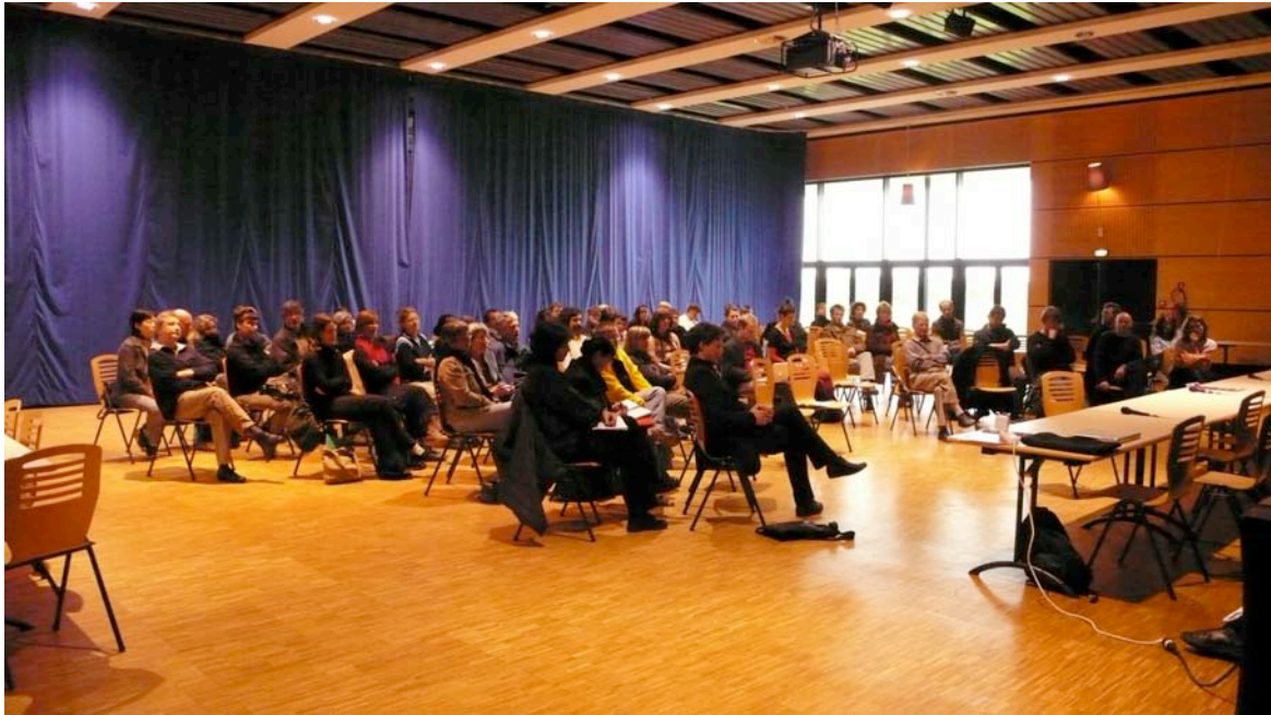
Rencontres Nationales FRAAP à Luçon en 2006

I - Communiqué de presse des Rencontres Nationales de la Fraap