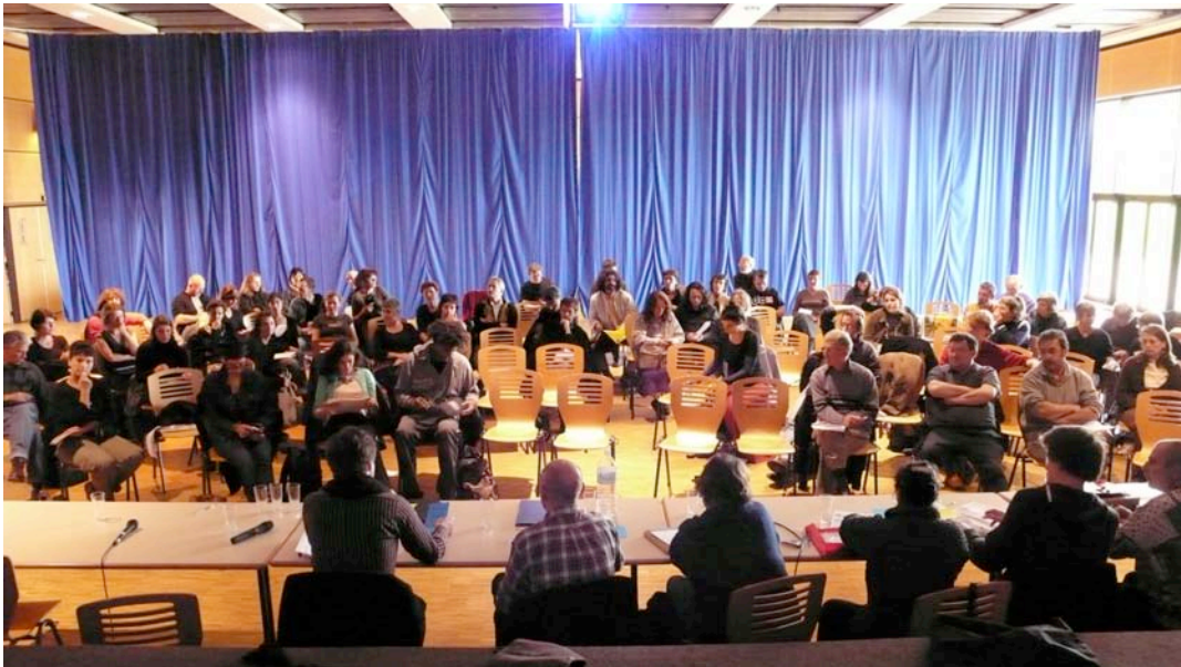
Rencontres Nationales FRAAP à Luçon en 2006

L'association « Les Moyens du Bord » accueille, en collaboration avec l'association l'Urgence de l'Art , les 7èmes Rencontres nationales de la Fédération des Réseaux et Associations d'Artistes Plasticiens (la Fraap).